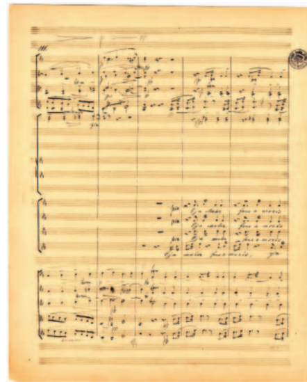
Antonín Dvořák: Stabat Mater, op. 58 - ukázka z autografní partitury