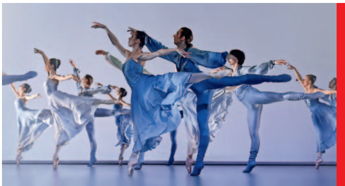
Stravinského Svěcení jara v podání baletu Národního divadla