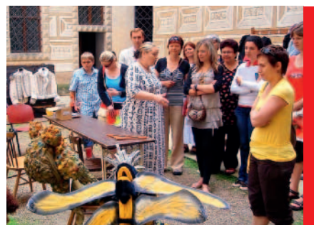
Loňská prohlídka zákulisím

Vstupenky lze zakoupit v pokladně Státní- ho zámku Litomyšl. Vstup do zákulisí bude