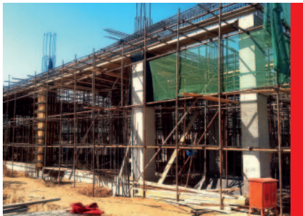
Czech China Centre - stavba výstavního pavilonu v Pekingu, stav z května 2011

Celková plocha 4800 metrů čtverečních, 2500 metrů výstavní plochy, 9 metrů výška sálů. Prozatím má název CCC - Czech China