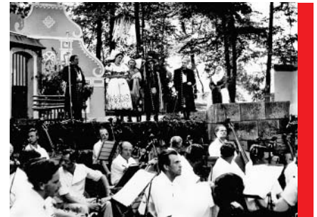
Prodaná nevěsta naplnila litomyšlský amfiteátr, 1957